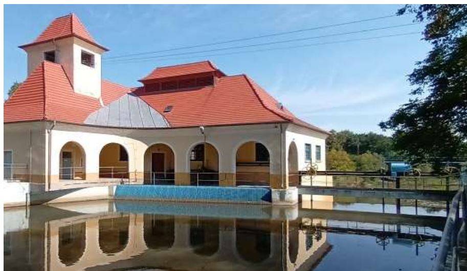
Budynek EW Marszowice

Zbiornik jest okresowo opróżniany, z wywożeniem ścieków przez wóz asenizacyjny.